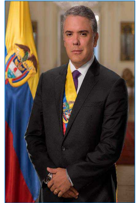
IVÁN DUQUE MÁRQUEZ Presidente de la República 2018-2022

En 2019 nuestra economía tuvo el crecimiento más alto desde hace cinco años y 615.000 colombianos salieron de la pobreza.