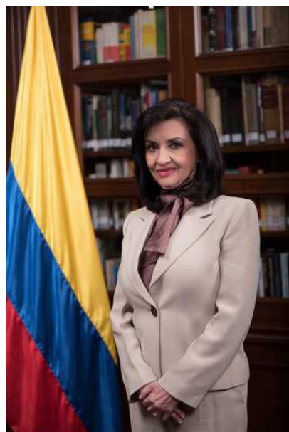
Canciller de Colombia, Señora Claudia Blum

La Embajada de Colombia saluda y desea muchos éxitos al señor Jeyhun Bayramov, nuevo Ministro de Relaciones Exteriores de Azerbaiyán, y le expresa su pleno interés en trabajar estrechamente para dar un renovado impulso a las relaciones entre Colombia y Azerbaiyán