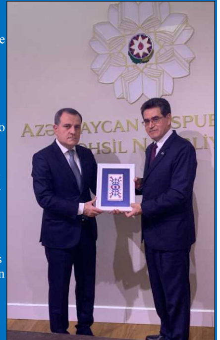
El Embajador Dimaté visitó en diciembre de 2019 al entonces Ministro de Educación y hoy Canciller de Azerbaiyán, Jeyhun Bayramov

Colombia y Azerbaiyán establecieron relaciones diplomáticas el 13 de diciembre de 1993. Desde entonces, los dos países mantienen excelentes relaciones bilaterales de amistad, basadas en el respeto mutuo y la cooperación. En diciembre de 2019, celebramos el 25 aniversario del establecimiento de estas relaciones con un hermoso acto cultural en la Filarmónica Estatal de Azerbaiyán, organizado con el especial apoyo del Ministerio de Cultura de Azerbaiyán, y la presentación de una variada muestra de danzas de los dos países, con arreglos coreográficos de la artista popular de Azerbaiyán y Vicerrectora de la Academia Coreográfica de Bakú, Tarana Muradova.