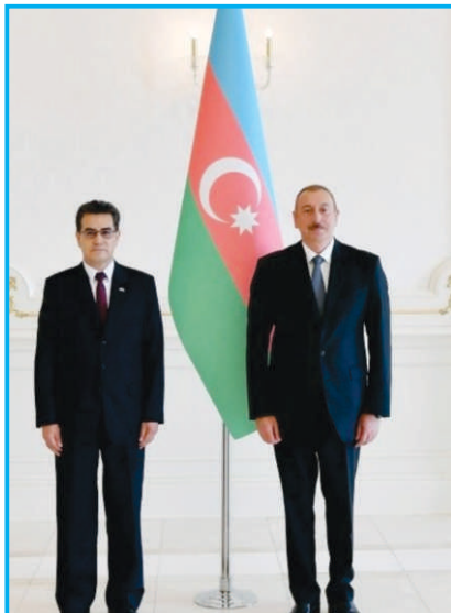
Reunión oficial con el señor Presidente, S.E. Ilham Aliyev para la Presentación de Cartas Credenciales

Para concluir, permítanme renovar al Gobierno y al pueblo de Azerbaiyán los deseos del Presidente Iván Duque y de nuestra Ministra de Relaciones Exteriores, Claudia Blum, de fortalecer aún más los lazos de amistad y cooperación que unen a nuestros dos países, así como nuestros votos por el bienestar y el progreso de Azerbaiyán.