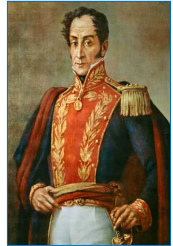
Simón Bolívar (1783-1830)

Genio político y militar a quien los colombianos debemos el haber sentado las bases para la conformación de nuestra nación y la fundación de la República. Su ideario social y político alimentó el despertar de la conciencia americana, y con ella la voluntad colectiva de autoafirmación soberana de los pueblos de América del Sur. Lideró la rebeldía de criollos, indios y negros que, en mítica epopeya, consiguió la independencia de la Nueva Granada (hoy Colombia y Panamá), Venezuela, Ecuador, Perú y Bolivia. Como gobernante, Bolívar consagró su inagotable energía y genialidad a cristalizar el sueño de una gran nación. Colombia, integrada por todos los pueblos andino-amazónicos hermanos.