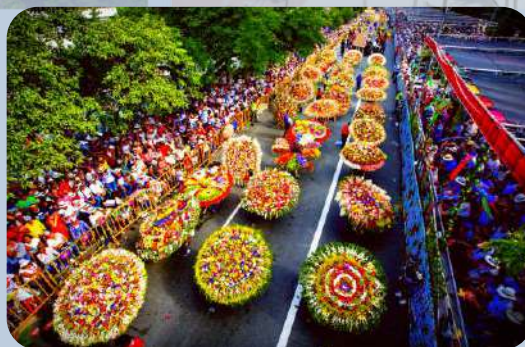
Festival de Flores, Medellín