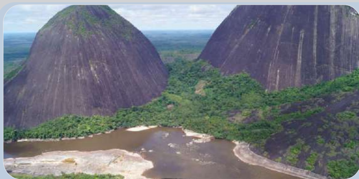
Guainía, Región Amazónica