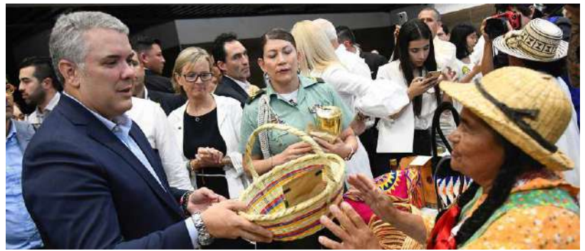
Presidente Iván Duque durante el cierre de la 8ª versión de 'Bioexpo Pacífico 2019' Yumbo, Valle, 19/10/2019

✓ Esta política está armonizada con la política para abordar el problema de las drogas ilícitas, Ruta Futuro, y con la Política de Defensa y Seguridad.