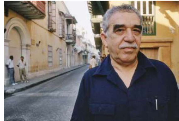
GABRIEL GARCÍA MÁRQUEZ (GABO) NUESTRO NOBEL DE LITERATURA

El escritor colombiano Gabriel García Márquez nació el 6 de marzo de 1927 en Aracataca, Colombia.