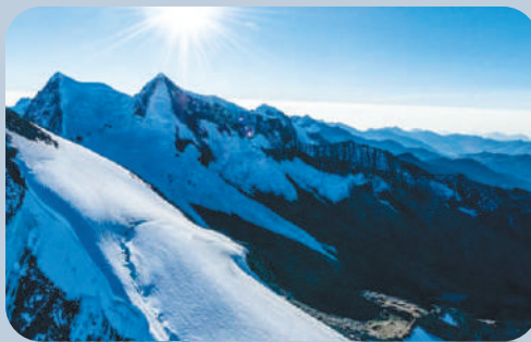
Sierra Nevada de Santa Marta