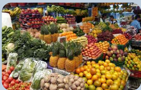
Plaza de mercado Paloquemao