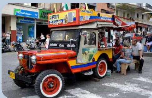
Camperito de Café colombiano