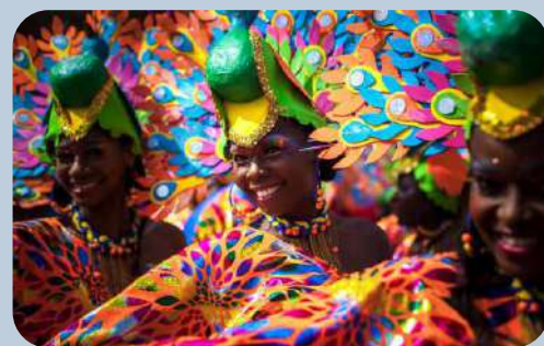
San Pacho festival (Quibdó)