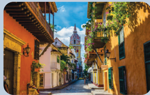
Cartagena de Indias