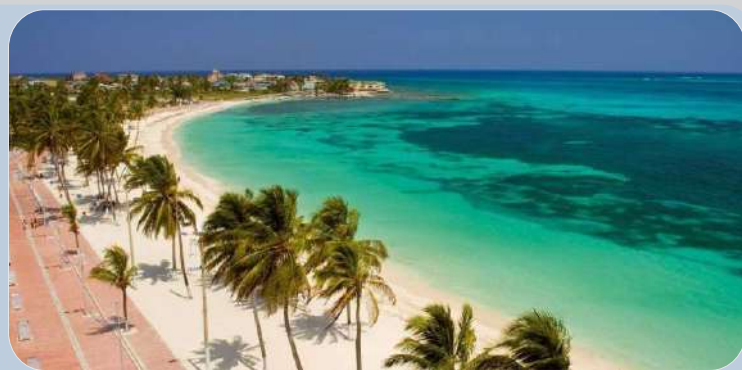
San Andrés Islas