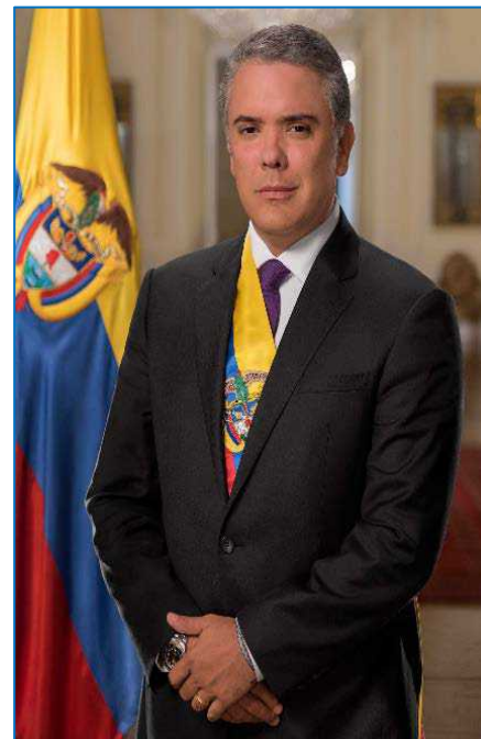
ИВАН ДУКЕ МАРКЕС Президент Республики 2018-2022

Политика «Мир с Законностью» вызывает преобразования в 170 муниципалитетах, наиболее пострадавших от бедности. Кроме того, правительство усиливает защиту правозащитников и общественных деятелей.