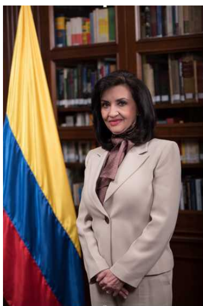
Министр иностранных дел Колумбии, Госпожа Клаудия Блум.

Азербайджана, успехов и выражает свою полную заинтересованность в тесном сотрудничестве, в целях придания нового импульса Колумбийско-Азербайджанским отношениям.