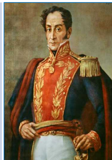
Симон Боливар (1783-1830 гг.)

Путеводитель: http://www.colombia.travel/es http://www.colombia.co/