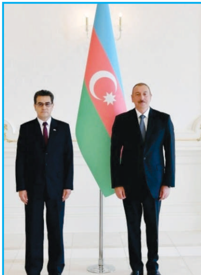
Официальная Встреча С Господином Президентом Ильхамом Алиевым для Представления Верительных Грамот

Поздравительное письмо господина Джейхуна Байрамова, министра иностранных дел Азербайджанской Республики своей коллеге