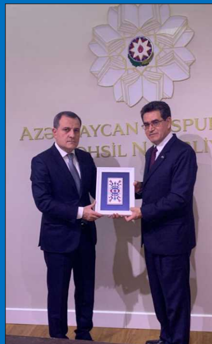
Посол Димате встретился в декабре 2019 года с тогдашним Министром образования, а ныне Министром иностранных дел Азербайджана Джейхун Байрамовым.

С тех пор две страны поддерживают прекрасные двусторонние дружеские отношения, основанные на взаимном уважении и сотрудничестве. В декабре 2019 года мы отметили 25-летие установления этих отношений прекрасным культурным событием в зале Государственной филармонии Азербайджана, организованном при особой поддержке Министерства культуры Азербайджана, и где были представлены разнообразные танцевальные шоу двух стран, с хореографическими аранжировками азербайджанского народного артиста и проректора Бакинской хореографической академии, Тараны Мурадовой