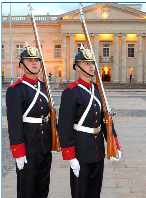
Каса Де Нариньо - Штаб-Квартира Правительства

Два столетия Республиканской жизни позволили Колумбии укрепить свою демократию и развить сильную институциональную структуру, с помощью которой ей удалось преодолеть большие трудности и добиться важных успехов в социальных и экономических вопросах.