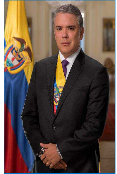
İVAN DUKE MARKES Respublikanın Prezidenti 2018-2022-ci illər üzrə

Qanunvericiliklə Sülh siyasəti yoxsulluqdan ən çox təsirlənən 170 əyalətdə inkişafa doğru dəyişikliklər yaradır. Bundan əlavə, Hökumət insan hüquqları müdafiəçilərinin və sosial liderlərin müdafiəsini gücləndirir.