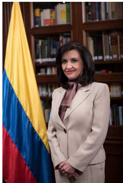
Kolumbiyanın Xarici İşlər Naziri xanım Klavdia Blum

Xarici İşlər Naziri Klavdia Blum Azərbaycan Hökumətini Milli Günü münasibətilə təbrik məktubunda hər iki xalqın rifahı və tərəqqisi naminə, turizm, mədəniyyət və təhsil sahələrinin, və həmçinin, siyasi və iqtisadi əlaqələrimizi möhkəmləndirməyə davam etməkdə Kolumbiya Hökumətinin xüsusi marağını vurğuladı.