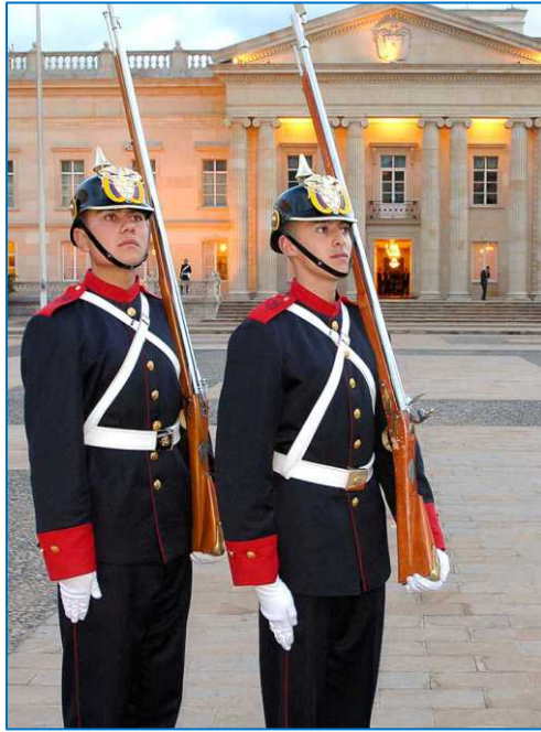
Kasa de Narinyo – Prezident İqamətgahı

İki əsrlik respublika həyatı Kolumbiya demokratiyasını möhkəmləndirməyə və güclü bir institusional inkişaf etdirməyə imkan verdi, bununla da böyük çətinliklərin öhdəsindən gəlmək və sosial və iqtisadi məsələlərdə mühüm nailiyyətlər əldə etmək mümkün oldu.