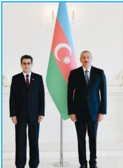
Zati-aliləri cənab Prezident, İlham Əliyev ilə Etimadnamənin təqdim edilməsi üçün rəsmi görüş

Azərbaycan Respublikasının Xarici İşlər Naziri, cənab Ceyhun Bayramovun öz həmkarına təbrik məktubu