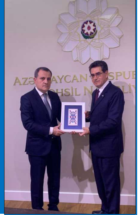
Səfir Dimate 2019-cu ilin dekabr ayında o vaxtki Təhsil Naziri və indiki Xarici İşlər Naziri cənab Ceyhun Bayramovu ziyarət etdi.

13 dekabr 1993-cü ildə Kolumbiya ilə Azərbaycan arasında ilk diplomatik münasibətləri qurulmuşdur. O vaxtdan bəri iki ölkə qarşılıqlı hörmət və əməkdaşlığa əsaslanaraq ikitərəfli münasibətləri yüksək səviyyədə davam etdirir. 2019-cu ilin dekabr ayında bu əlaqələrin qurulmasının 25-ci ildönümünü Azərbaycan Mədəniyyət Nazirliyinin və məşhur xalq artisti, Bakı Xoreoqrafiya Akademiyasının prorektoru Tərənə xanım Muradovanın dəstəyi ilə hər iki ölkəyə məxsus rəqs nümunələri Azərbaycan Dövlət Filarmoniyasında mədəni tədbir çərçivəsində qeyd edilmişdir.