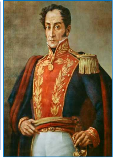
Simon Bolivar (1783-1830)

Ziyarət etmək üçün internet saytları: http://www.colombia.travel/es http://www.colombia.co/